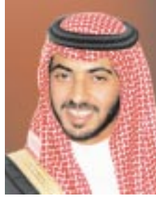
سموّ الشيخ حمدان بن زايد آل نهيان وزير الدولة للشؤون الخارجية نائب رئيس مجلس الإدارة