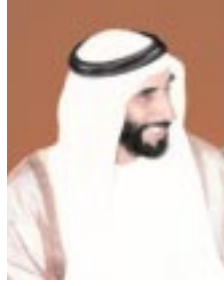
صاحب السموّ الشيخ زايد بن سلطان آل نهيان رئيس دولة الإمارات العربية المتحدة