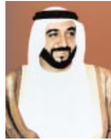
صاحب السموّ الشيخ خليفة بن زايد آل نهيان وليّ عهد أبوظبي نائب القائد الأعلى للقوات المسلحة رئيس مجلس الإدارة